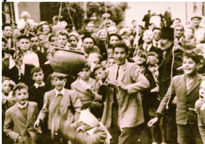
... Réponse dans la prochaine édition !!!