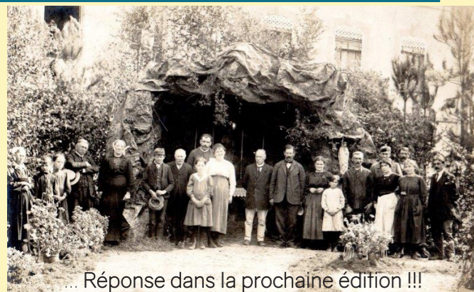
... Réponse dans la prochaine édition !!!